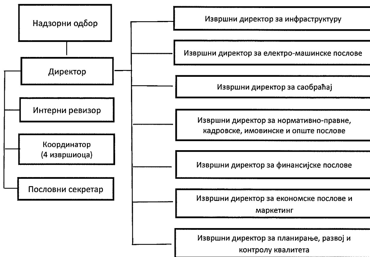
Организациона шема ЈКП „Београдски метро и воз“

Након добијања сагласности Скупштине града Београда на Одлуку о измену Статута, број 641-2/22 од 31.08.2022. године, Предузеће ће имати седам извршних директора.