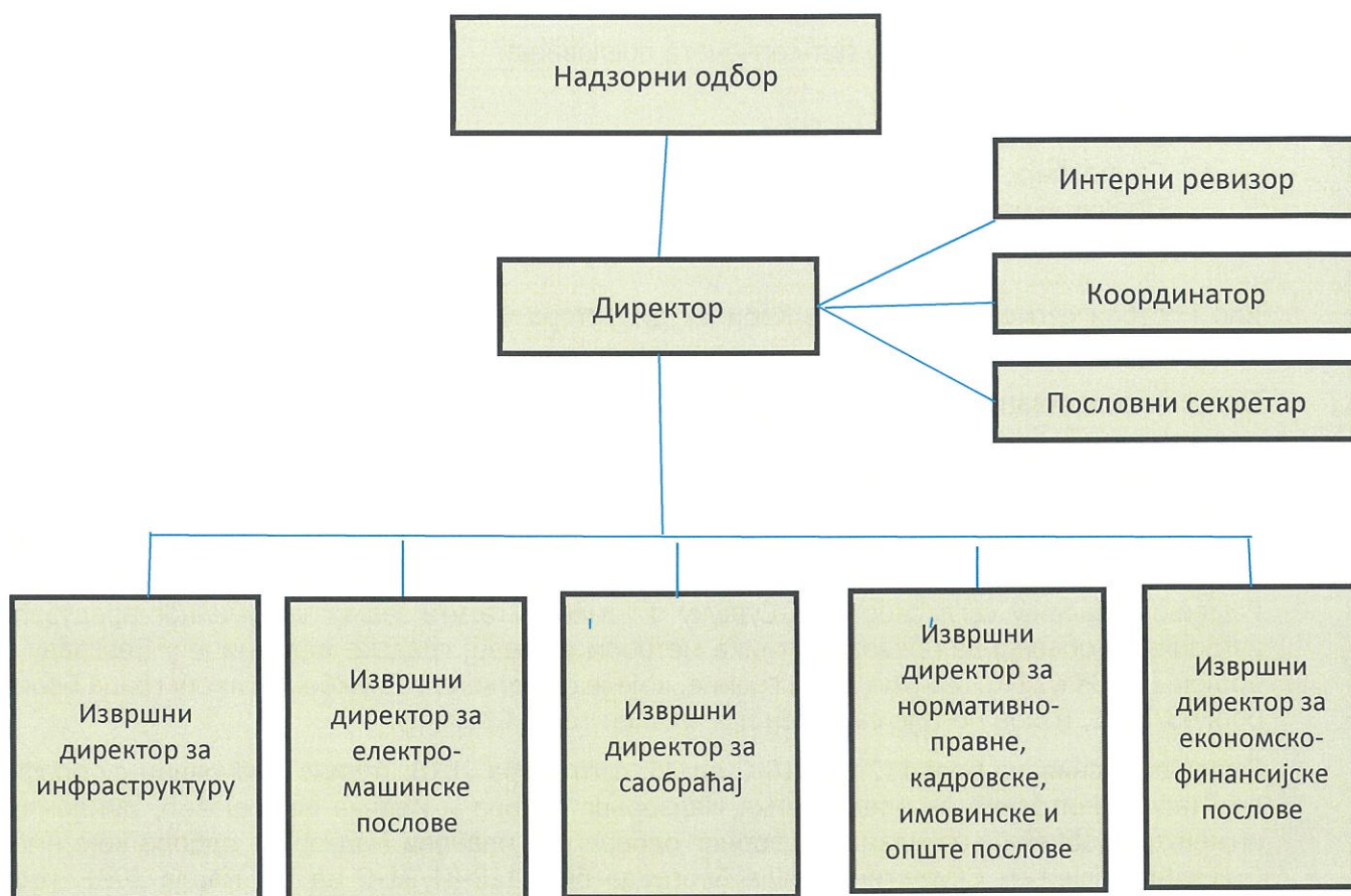
Организациона шема ЈКП „Београдски метро и воз“